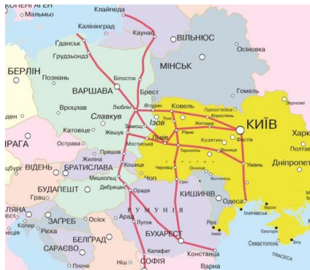
Рис. 2. Автомобільні дороги міжнародного значення, що проходять по території Тернопільської області

Слід відзначити, що Тернопільська область має вигідне геополітичне розташування, оскільки по її території проходять магістралі міжнародного значення, які надають місцевим перевізникам суттєву конкурентну перевагу. Територією Тернопільської області проходять дві європейські автомобільні дороги E50 (ділянка Стрий - Тернопіль - Кропивницький - Дніпро - Донецьк - Дебальцеве) і E85 (ділянка Ковель - Луцьк - Дубно - Тернопіль - Чортків - Чернівці) (рис.2).