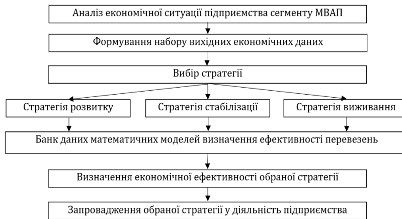
Рис. 3. Алгоритм визначення економічної ефективності підприємств сегменту міжнародних вантажних перевезень

автопарку, ефективності за критерієм прибутковості та ряду інших методичних підходів (табл. 1).