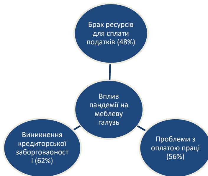
Рисунок 2. Вплив пандемії на меблеву галузь [2]

Керівники меблевих організацій запевнили, що через 6 місяців їм вдасться відновити рівень обороту, який передував епідемії (51% компаній вказали на це), а окремим організаціям вдасться відновитись за рік (32%) або два (17%). Щодо зайнятості персоналу, то майже усі опитані підприємства вели мову про проведення скорочень персоналу або відправлення у відпустки. Окрім цього, більше 20% вдалися до звільнення персоналу [2].