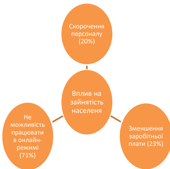
Рисунок 4. Вплив пандемії на зайнятість населення [2]

нестача інвестиційних ресурсів, а після війни можна очікувати, що нестача внутрішніх інвестицій буде можливо компенсуватись іноземними» [4].