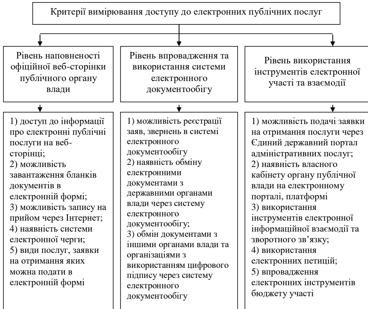
Рис. 2. Критерії вимірювання доступу до електронних публічних послуг

W_i – коефіцієнти вагомості i -х часткових показників.