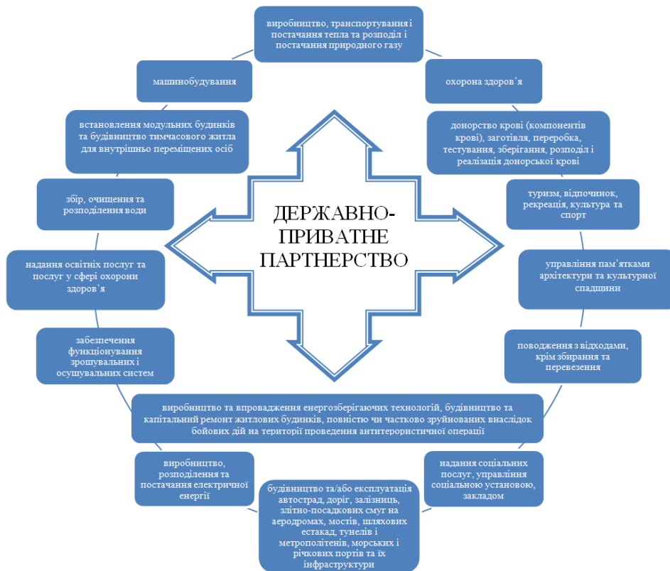
Рис. 1. Сфера дії державно-приватного партнерства в Україні

«... це співробітництво між державою України, Автономною Республікою Крим, територіальними громадами в особі відповідних державних органів, здійснюють управління об'єктами державної власності, органів місцевого самоврядування, Національною академією наук України, національних галузевих академій наук (державних партнерів) та юридичними особами, крім державних та комунальних підприємств, установ, організацій (приватних партнерів), що здійснюється на основі договору в порядку, встановленому цим Законом та іншими законодавчими актами ...».