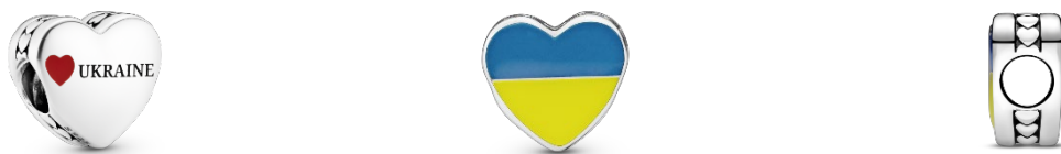
Рисунок 2 – Намистини для браслету бренду PANDORA «Любов до України»

Модульні браслети є, так звані, топовим продуктом компанії PANDORA, і саме на них зорієнтовано всі наступні нові колекції. Насамперед такою популярністю та стійким становищем на ринку коштовностей даний бренд завдячує своїй швидкій адаптивній стратегії, яка зокрема полягає в швидкому представленні різного роду тематичних намистин для модульного браслету (рис. 2 [1]).