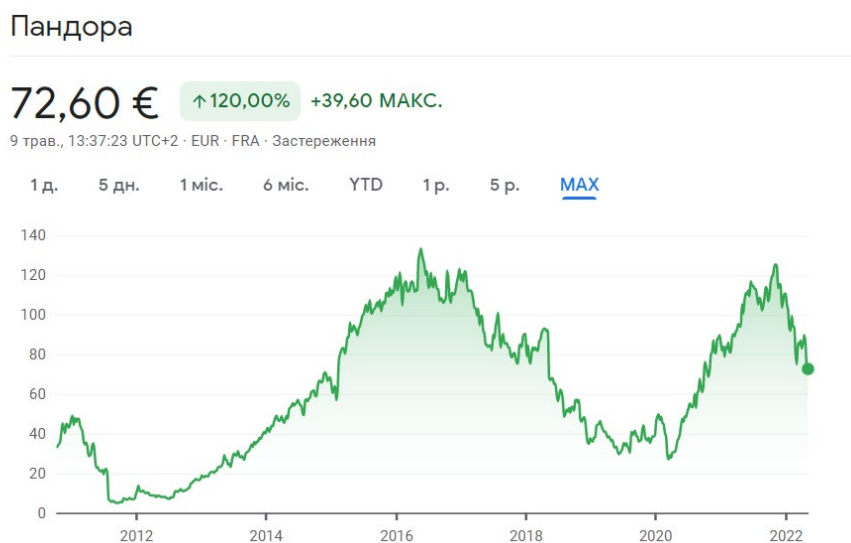
Рисунок 3 – Динаміка цін на акції компанії PANDORA

Компанія PANDORA старається йти в ногу з часом та постійно розвивається, тому в 2010 році вона змінила форму власності, ставши публічним акціонерним товариством, що посприяло розміщенню її власних цінних паперів на Копенгагенській торговій біржі (рис. 3 [4]).