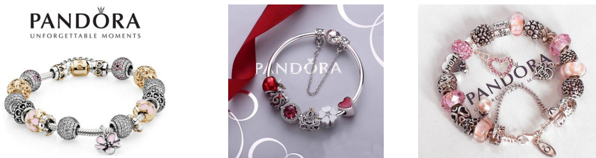
Рисунок 1 – Модульний браслет бренду PANDORA

Завдяки правильно підібраній та успішно застосованій творчій концепції дизайнерів бренду, було створено відомий, браслет PANDORA, який і досі залишається візиткою цієї торгової марки. Вигляд легендарного браслету бренду PANDORA представлено на рис. 1.