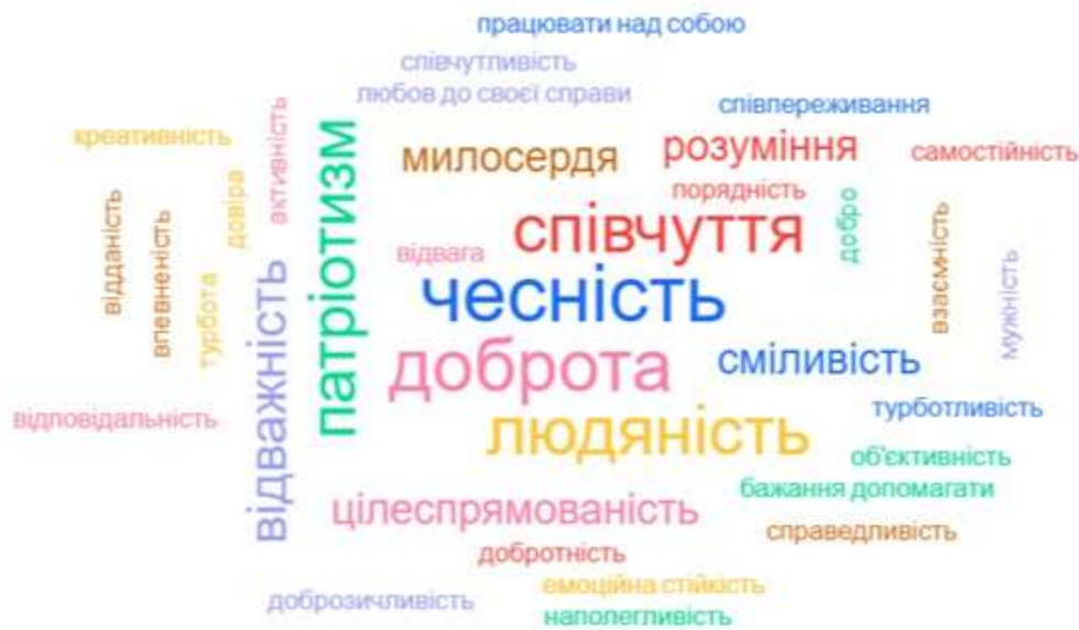
Рис. 2. Найважливіші якості особистості

Отже, навіть не дуже глибокий огляд тенденцій розвитку російської педагогічної науки дає змогу виявити ряд суперечностей, які спричинили війну 2022 року та її жорстокий характер: між великодержавницькою позицією Росії щодо інших народів та її намаганням «захистити» ці народи; між проголошенням ціннісних начал в освіті та лицемірним ставленням до їх дотримання серед окремих категорій громадян; між педагогічною культурою та глибинною орієнтацією на політичне замовлення.