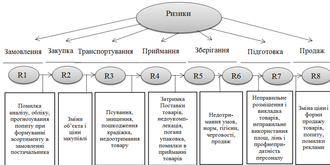
Рисунок 2. Сутність та виклад змісту комерційної операції [17]

з метою визначення основних і допоміжних економічних чи статистичних показників та чинників, котрі впливають на такі операції, їх причинно-наслідковий зв'язок. Це дає змогу встановити можливі причини відхилення зазначених показників від нормативних чи запланованих. Саме вони і породжують базис для виникнення комерційних та маркетингових ризиків підприємства (рис. 2).