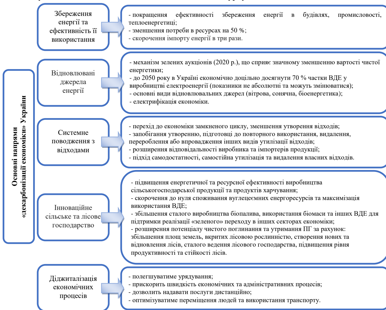
Рисунок 1. Основні напрями «декарбонізації економіки» України

Оскільки, ЄС затвердив та представив стратегічний курс на перехід до безвуглецевої економіки до 2050 року, так звана, «Зелена угода» (2020 р.), що включає заміщення енергетичних систем на викопному паливі відновлювальною електроенергією та відновлювальними газами (водень, біометан, синтетичний метан), тому дане рішення вступає певною основою національних та корпоративних цілей, довготривалих стратегій, інвестиційної політики із застосуванням інноваційних технологій, що передбачають сталий безвуглецевий розвиток. Сучасні нафтові компанії з врахуванням цього, до 2050 року мають розглядатися не лише як одні із джерел забруднення навколишнього середовища, а як ключова умова для досягнення цілей такого Зеленого курсу.