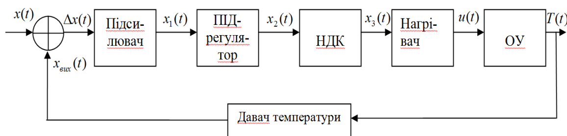
Рисунок 1. Функціональна схема САР

Функціональна схема системи автоматичного регулювання температури в скловарній печі представлена на рис. 1. Функціональні елементи системи: підсилювач, ПІД-регулятор, нелінійний динамічний коректор, нагрівач, давач температури, піч.