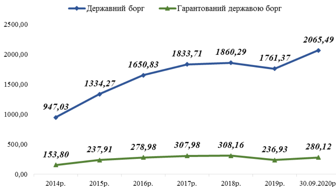
Рис. 3. Динаміка співвідношення результатів державного та гарантованого державою боргів за 2014-30.09.2020 роки, млрд. грн.*

Динаміку співвідношення результатів державного та гарантованого державою боргів протягом 2014-30.09.2020 років представлено на рис. 3.