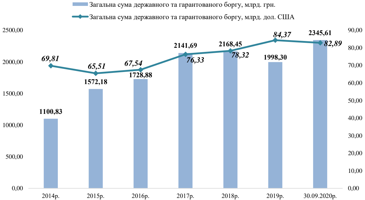
Рис. 1. Динаміка загальної суми державного та гарантованого державою боргу протягом 2014 р. – 30.09.2020 р.

Так, за 2015 р. сума цього показника становила 1572,18 млрд. грн., тобто на 471,35 млрд. грн. (42,82 %) більше, ніж сума показника за 2014 р. (1100,83 млрд. грн.).