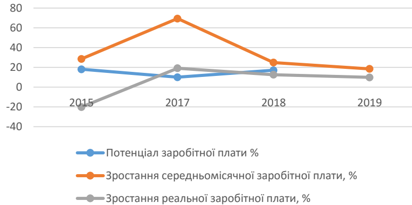
Рисунок 2. Динаміка показника потенціалу заробітної плати в Україні*