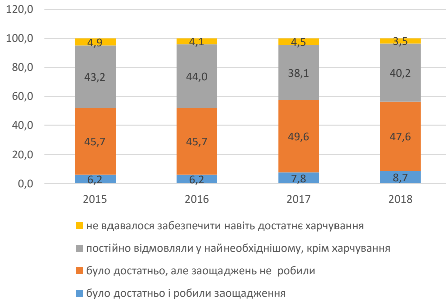
Рисунок 1. Розподіл домогосподарств за самооцінкою рівня їх доходів (%)*

прожиткового мінімуму. Й тут криється небезпека, адже некоректно визначені стандарти чи спрощена методика обчислення показника викривляє реальні дані. Наприклад, важливо зрозуміти, що домогосподарства оцінюють доходи стосовно всієї сім'ї, а ось прожитковий мінімум розраховується на одну особу.