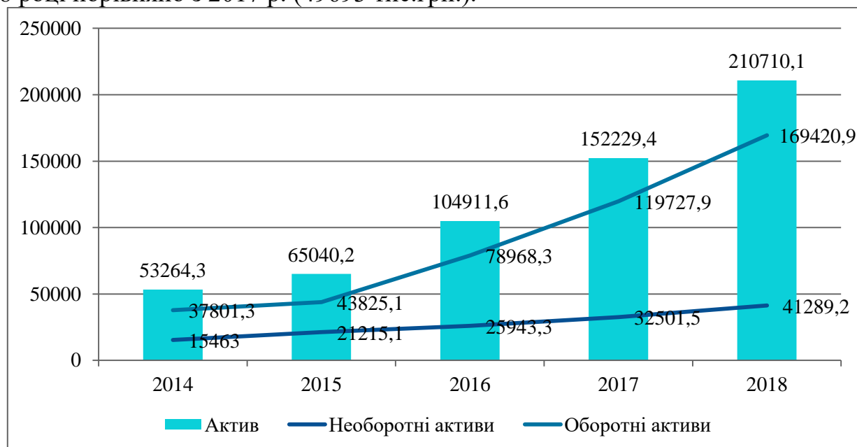
Рисунок 1. Динаміка складових активів ПАП «Топільче»

Проведено аналіз основних показників діяльності підприємства за 5 років (2014-2018 рр.), який показав наступне (рис.1): найбільші абсолютні відхилення в складі активів ПАП «Топільче» спостерігалися у зміні вартості оборотних активів у 2018 році порівняно з 2017 р. (49693 тис.грн.).