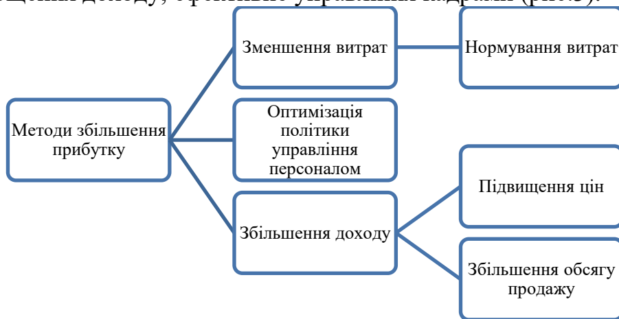
Рисунок 3. Методи підвищення рівня прибутку

Запропоновано ПАП «Топільче» в процесах управління прибутком використовуватися наступні групи методів підвищення рівня прибутку: скорочення витрат; нарощення доходу; ефективне управління кадрами (рис.3).