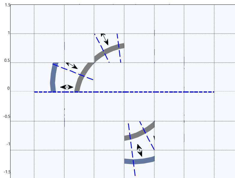
Рисунок 1. Повітряний зазор при наявності одночасній некорельованій еліптичності ротора і статора

Порушення просторової симетрії магнітного поля, що виникає в повітряному зазорі між ротором і статором електродвигуна, викликають виникнення небажаних вібрацій, які можуть негативно вплинути на роботу двигуна. Однією із причин такої асиметрії є відхилення від циліндричності статора чи ротора. Розглянуто випадок, коли такі відхилення спричинені некорельованою еліптичністю, і обумовлюють періодичні зміни величини повітряного зазору, а значить і магнітної провідності в процесі роботи двигуна. Даються оцінки повітряного зазору для даного випадку (Рис.1) та спектральні характеристики вібрацій, спричинених даними дефектами.