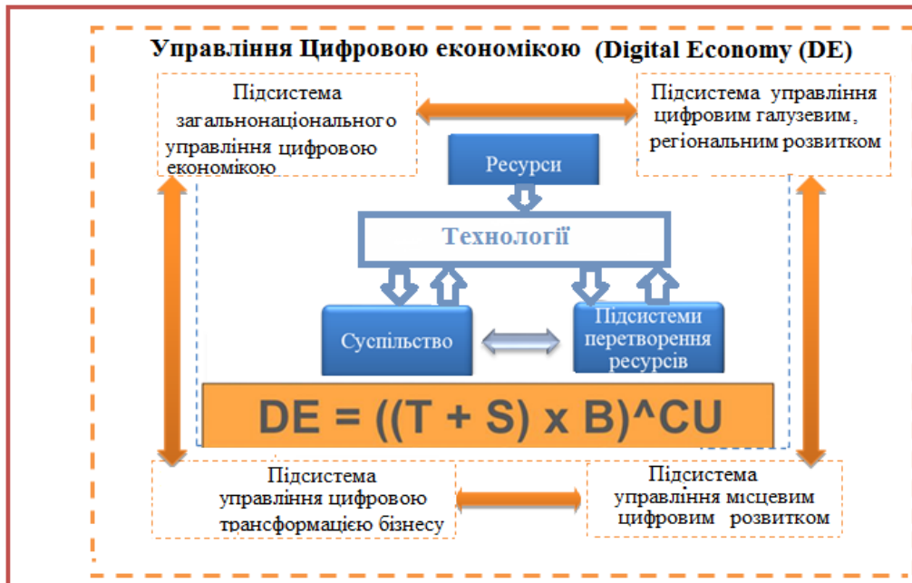
Рис. 1. Схема зв'язків між рівнями цифрової національної економіки як системи

визначається та трансформується відповідно до конфігурацій взаємозв'язків між усіма її суб'єктами та об'єктами, то цілком очевидно, що ефективно взаємодіяти ці елементи можуть лише за умов збалансованого моновекторного впливу підсистем національного управління, управління регіональним, місцевим розвитком та управління мікро рівня (бізнес середовище). Не можна забувати звісно і про «глобальне тло», тобто підсистеми міжнародного управлінського впливу у випадку цифрової трансформації економіки це Єдиний цифровий ринок ЄС до якого має намір долучитися наша країна.