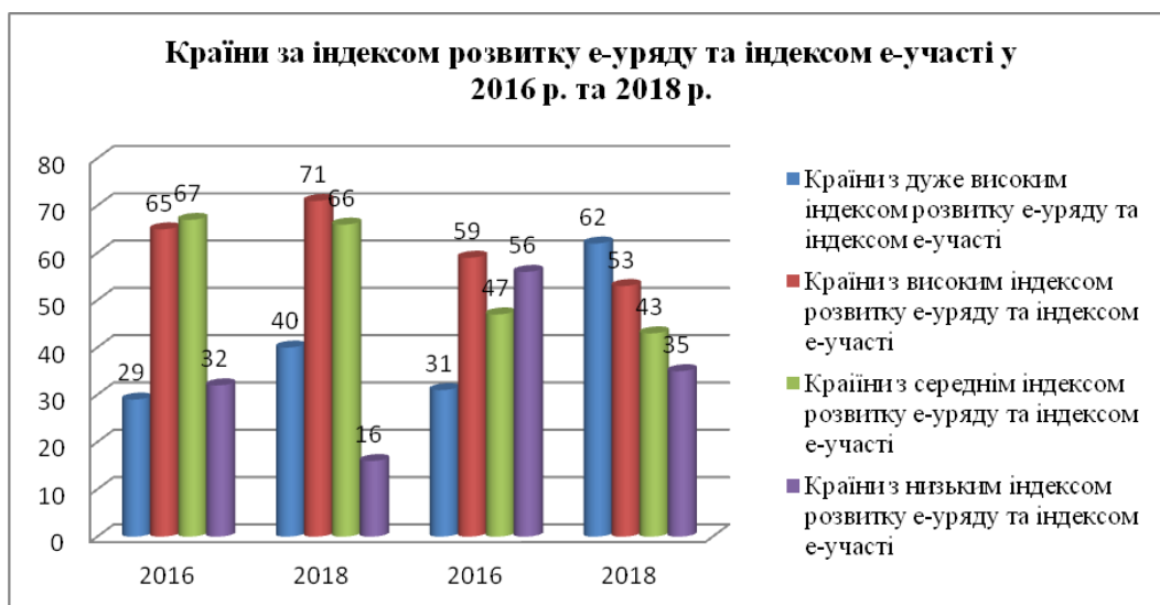
Рисунок 1 – Кількість країн, згрупованих за індексами електронного уряду EGDI та електронної участі EPI у 2016 та 2018 рр.

Для оцінювання надання інтерактивних інформаційних послуг громадянам крім індексу розвитку електронного уряду EGDI застосовують додатковий індекс електронної участі EPI (E-Participation Index), який базується на трьох складових: е-інформування, е-консультування та е-прийняття рішень. За даними дослідження ООН за період 2016-2018 рр. вдвічі зросла кількість країн з дуже високим індексом електронної участі EPI (з 31 країни у 2016 р. до 62 країн в 2018 р.) [2]. Кількість країн з високим та середнім рівнем електронної участі дещо зменшилася, оскільки багато з них перейшли до групи країн вищого рівня електронної участі. Спостерігається позитивна тенденція до використання урядами механізмів електронної участі, оскільки відбулося скорочення кількості країн з низьким індексом електронної участі EPI з 35 до 16 за останні 2 роки (рис. 1).