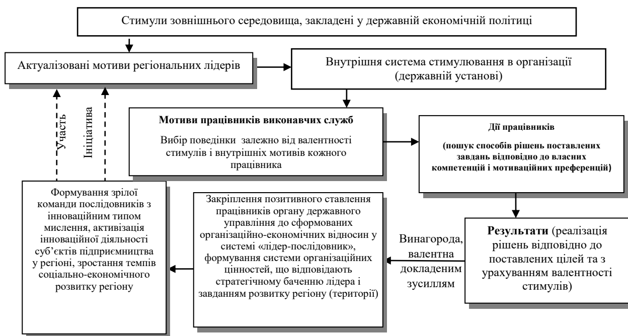
Рисунок 1. Структура мотиваційного процесу у відносинах «лідер-послідовники» в контексті управління розвитком регіонів

Слід зазначити, що в багатьох дослідженнях лідерства як соціального явища науковці виокремлюють такі основні функції: інноваційну, комунікативну, світоглядну, організаторську, прогностичну, мобілізаційну, інформаційну, контролюючу [2, 3]. Проте мобілізаційну функцію доцільніше було б ідентифікувати як функцію мотивування і вона є чи не найбільш важливою у зазначеному переліку. Аналізуючи досвід успішного реформування, можна стверджувати, що лідерство як інструмент досягнення цілі або результату, опирається не на примушування, а на мотивування. Відображення впливу мотиваційного чинника для формування ефективної взаємодії всередині управлінської команди в розрізі регіонального управління можна подати схематично (рис.1).