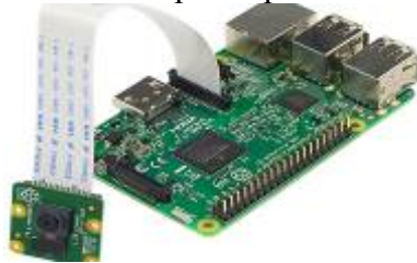
Рисунок 2. Зовнішній вигляд комп'ютера Raspberry Pi 2B та модуля відеокамери [3]

Фізична модель пристрою. Фізичними моделюванням називається вивчення властивостей явищ або процесів на фізичних моделях, які замінюють собою об'єкт, який в такому випадку називається натурою. В якості апаратного забезпечення фізичної моделі пропонується реалізація структури пристрою на основі одноплатного міні-комп'ютера Raspberry Pi та відеокамери RaspiCam. Даний вибір пояснюється низькою його вартістю, необхідною функціональністю, поширеністю, надійністю та потужною спільнотою розробників міні-комп'ютера. Зовнішній вигляд плати комп'ютера Raspberry Pi 2B з підключеною відеокамерою представлений на рис. 2.