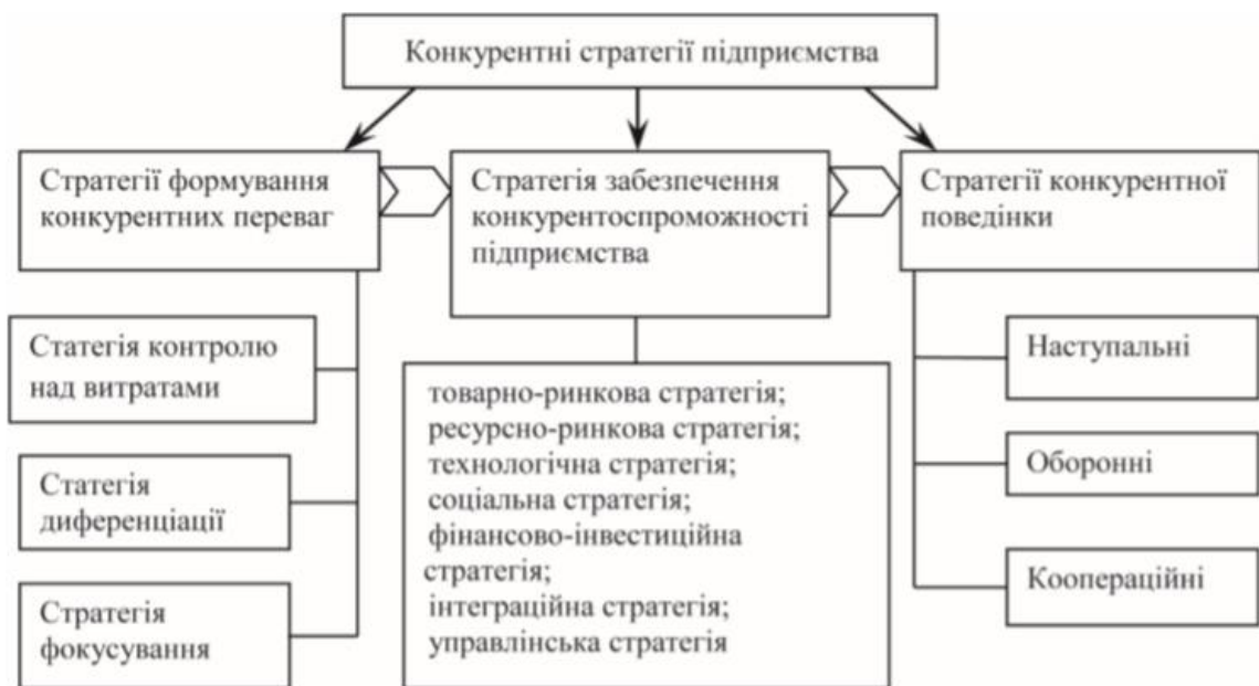
Рис. 2. Система конкурентних стратегій підприємства

має свої особливості для підприємств різних розмірів, сфер діяльності, організаційно-правових форм. Конкурентні стратегії підприємства повинні бути адаптованими до особливостей структури конкурентного середовища, а також до особливостей динаміки ринку.