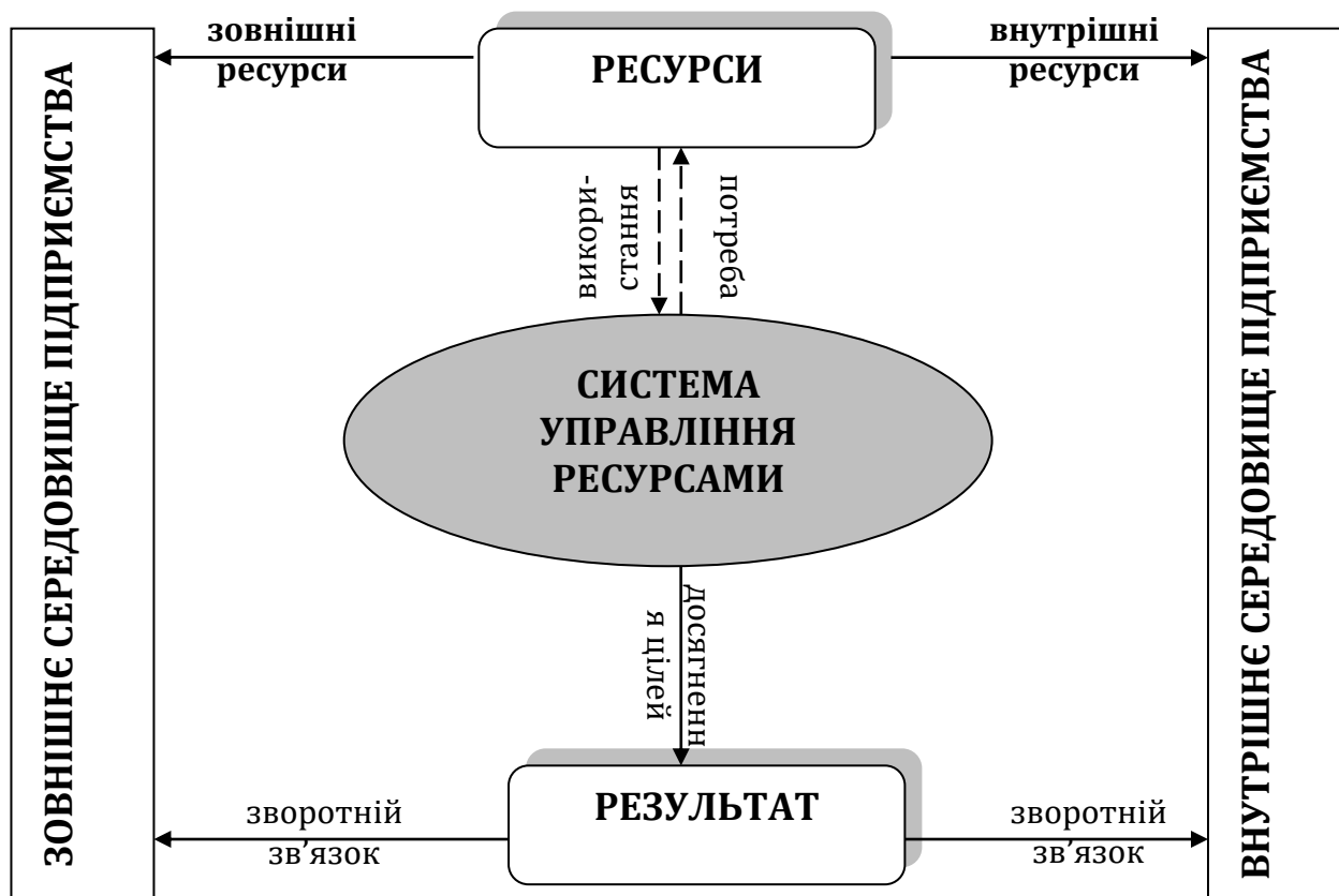
Рис. 1. Принципи функціонування ресурсів в системі управління підприємством

Таким чином, соціальні ресурси є важливим фактором ефективності господарської діяльності підприємств, в основі якого покладено взаємодія бізнесу, людини та суспільства, як всередині підприємства, так і за його межами. У зв'язку із цим, соціальні ресурси доцільно поділяти на внутрішні (відображають особливості формування та використання ресурсів) та зовнішні (відображають особливості взаємодії підприємства з навколишнім середовищем), що схематично представлено на рис. 2.