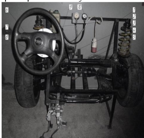
Рисунок 1. Стенд для дослідження параметрів гальмівних властивостей автомобіля : 1 – рама; 2 – стійка; 3- електродвигун; 4 – піввісь; 5 – колесо; 6 – кермо; 7 – рейка; 8 – шкала; 9 – гідронасос; 10 - манометр

Машинобудівна промисловість має багатогалузеву структуру і практично в кожній галузі використовуються гальмівні механізми. В свою чергу ефективність гальмування визначається як конструктивними особливостями, так і експлуатаційними характеристиками вузлів і механізмів гальмівної системи.