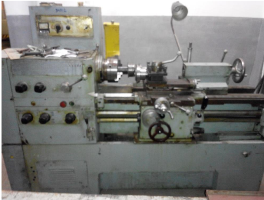
Рисунок 2 – Загальний вигляд верстата із закріпленим приспособленням.

дає змогу одночасного гнуття полицки та розтягування гвинтової спіралі на відповідний крок.