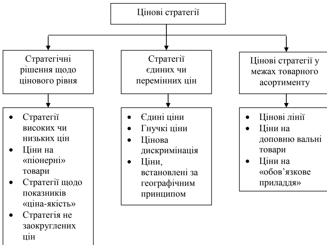
Рис. 4.3. Класифікація цінових стратегій

Розробка цінової стратегії передбачає прийняття великої кількості різних рішень (рис. 4.3).