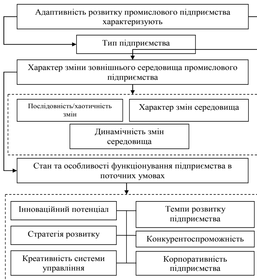
Рис. 1. Характеристики адаптивного розвитку промислового підприємства*