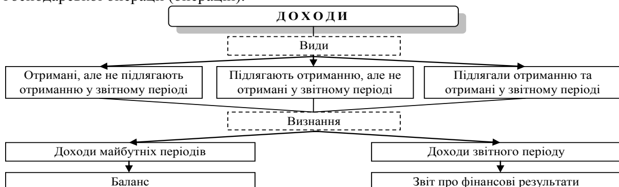
Рис. 1. Визнання та відображення доходів у фінансові звітності

Згідно з П(С)БО 15 “Дохід”, визнається під час збільшення активу або зменшення зобов’язання, що зумовлює збільшення власного капіталу (крім внеску учасників), за умови, якщо оцінка доходу може бути достовірно визначена. Критерії визначення доходу при цьому використовуються окремими елементами однієї операції або за двома чи більше операціями разом, якщо це впливає із змісту такої господарської операції (операцій).