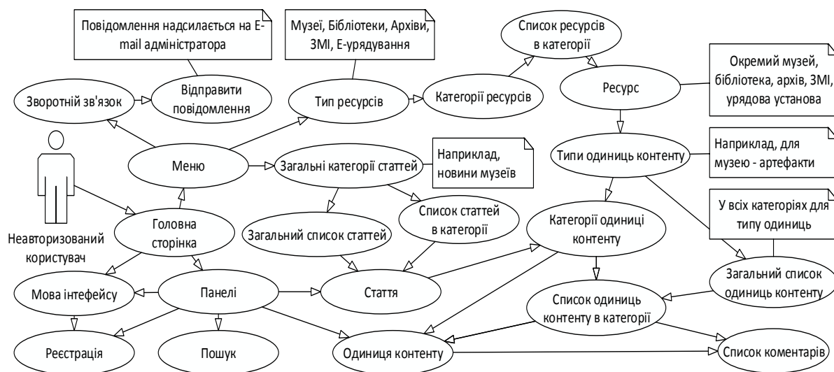
Рис.2 – Діаграма використання usecase для актора «Неавторизований користувач»

Сценарій використання консолідованого інформаційного ресурсу для неавторизованого користувача [2] наведений на рисунку 2.