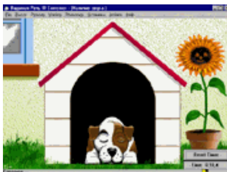
Рис.3. Скриншот програми Модуль "Наявність звуку"

Модуль "Наявність звуку" – забезпечує знайомство пацієнта з принципом роботи програми, а так само дозволяє виміряти тривалість мовленнєвого видиху в секундах. Анімаційна картинка змінюється при будь-якій активності в мікрофон. Заставка із зображенням собаки оживає при тривалому мовленнєвому видиху, який можна виміряти, зафіксувати, а також прослухати, якщо це голосова вправа (рис.3).