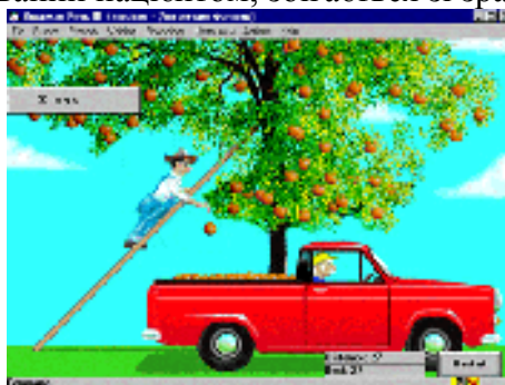
Рис.2. Скриншот програми Модуль "Автоматизація фонем"

Модуль "Автоматизація фонем" дозволяє відпрацювати фонемні записи за принципом досягнення якості вимови. Записана заздалегідь як зразок фонема пропонується дитині для відпрацювання способом "повтори так само". При цьому організовується ігрова ситуація в якій "фермер" підіймається сходами і скидає апельсин тільки в тому випадку, якщо звук, виголошуваний пацієнтом, збігається зі зразком (рис.2).