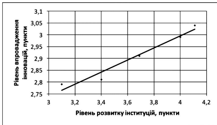
Рис. 7 Залежність між рівнем розвитку інституцій та рівнем впровадження інновацій в Україні

На рис. 7 представлено регресійну залежність впливу рівня впровадження інновацій в муніципальних економічних системах (в розрізі міст України) на вихідний параметр – рівень розвитку інституцій у регіональному вимірі. Впровадження інновацій є актуальним для розвитку приладобудівних підприємств, оскільки ця галузь є інноваційно орієнтованою.