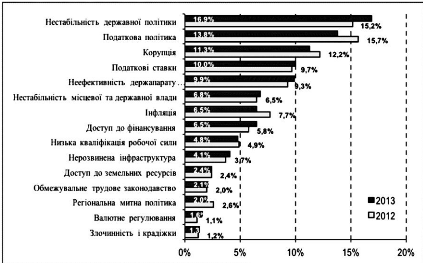
Рис. 1 Найпроблемніші фактори для ведення бізнесу в Україні*