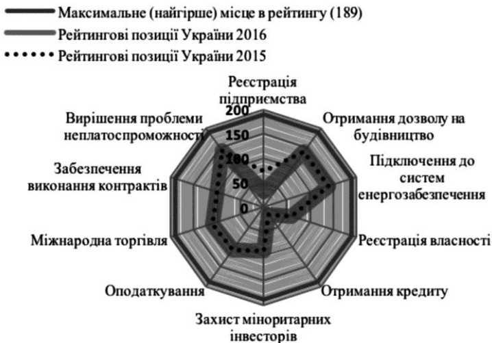
Рис. 5. Позиції України за основними показниками рейтингу легкості ведення бізнесу*

Отримані результати підтверджуються й іншими авторитетними дослідженнями. Наприклад, рейтинг «Doing Business» охоплює 189 держав світу і умови для ведення бізнесу протягом II півріччя 2014 – I півріччя 2015 років, у межах якого здійснена оцінка за найбільш суттєвими для бізнесу умовами бізнесу (рис. 5).