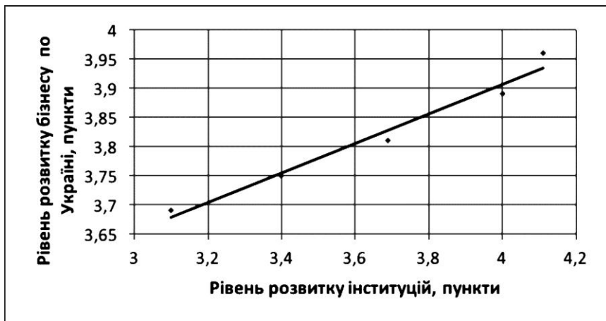
Рис. 6. Залежність між рівнем розвитку інституцій та рівнем розвитком бізнесу в Україні

Коефіцієнт кореляції між показниками рівня інституцій та рівнем розвитку бізнесу вказує на щільність зв'язку ( D^2 = 0,97 ).