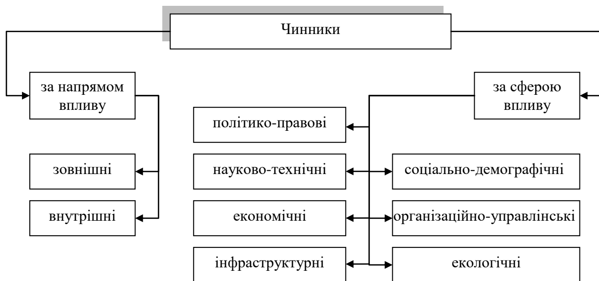
Рис. 1. Класифікація чинників забезпечення розвитку економіки знань

Зовнішні чинники забезпечення розвитку економіки знань відображають взаємозв'язок вітчизняних інститутів економіки знань із зовнішнім середовищем: інтернаціоналізація та глобалізація світової економіки, ступінь інтегрованості економіки країни у світову економіку, рівень міжнародної конкурентоспроможності країни, місце країни в світовому науково-технічному розвитку тощо. Внутрішні чинники діють на національному рівні та регулюються державою: ступінь політичної та економічної незалежності країни, тип економічної системи, її інноваційний потенціал тощо.