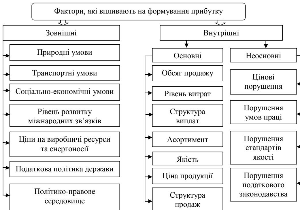
Рис. 1. Фактори, які впливають на формування прибутку підприємства

Визначення основних напрямів пошуку резервів збільшення прибутку передбачає класифікацію факторів (рис. 2), що впливають на можливість і розміри їх отримання, на внутрішні і зовнішні.