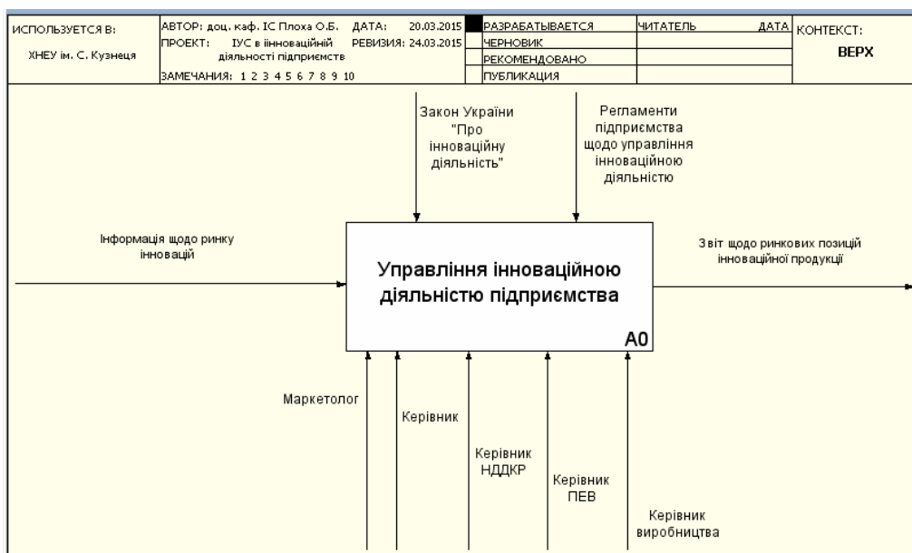
Рис. 1. Контекстна діаграма бізнес процесу

Моделювання системи управління інноваційною діяльністю з метою її подальшої автоматизації є оптимальним засобом виявлення проблем щодо реалізації певних бізнес-процесів на підприємстві, оптимізації потоків інформації та створення відповідних баз даних для оцінки інформації та прийняття ефективних управлінських рішень. Для успішного моделювання з використанням IDEF0-методології об'єкт проектування має бути адекватно описаний, побудовані повні і несуперечливі функціональні моделі ІС. На рис. 1 представлено функціональний блок, основні вхідні та вихідні інформаційні потоки, регламенти та відповідальних за процес управління інноваційною діяльністю. На рис. 2 представлені основні декомпозиційні блоки, які розкривають сутність процесу управління інноваційною діяльністю, виходячі зі стадій його реалізації [2,3]. На рис. 3 представлено декомпозицію бізнес-процесу А1, в основу якого покладено послідовність етапів розробки інноваційної ідеї від дослідження інноваційного оточення та можливостей до розробки бізнес-плану інноваційної ідеї [1-3].