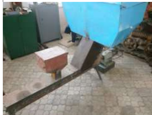
Рис. 1 Установка для подрібнення і змішування кормів