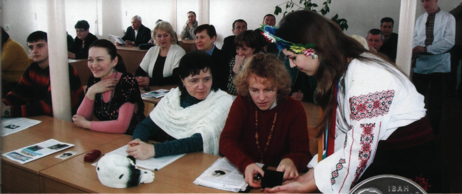
Результати діяльності університету за 2010 рік

присвяченої Іванові Пулюю, яку Національний банк України, продовжуючи серію «Видатні особистості України», ввів в обіг з нагоди відзначення 165-річчя від дня народження видатного вченого.