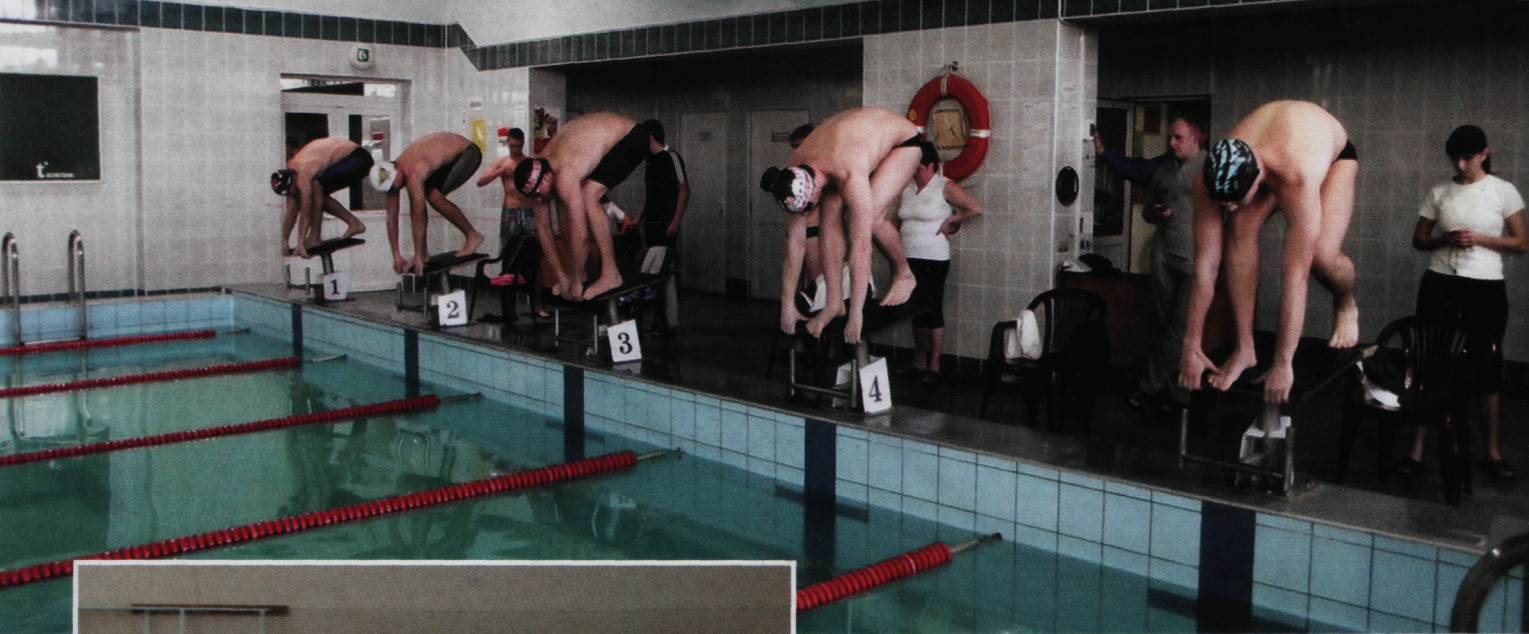
Результати діяльності університету за 2011 рік