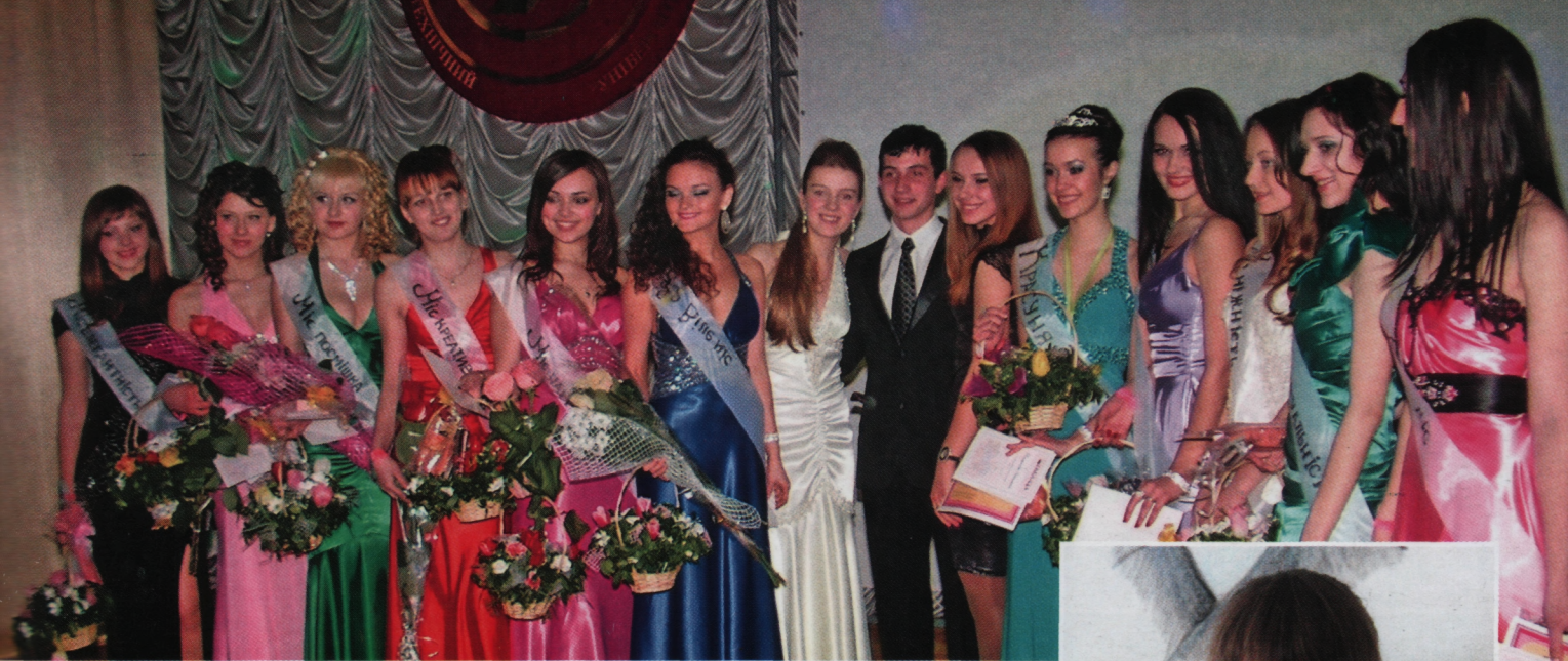
Результати діяльності університету за 2011 рік

дентське самоврядування у нашому житті». Під час наради було обговорено питання вдосконалення діяльності студентської ради, ролі органів студентського самоврядування, популяризації університетської науки, обмін досвідом тощо.