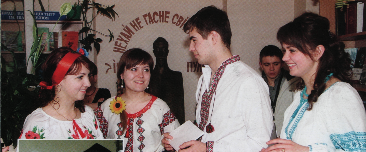
Результати діяльності університету за 2011 рік