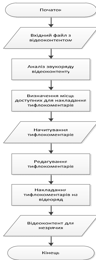
Рисунок 4. Блок-схема алгоритму створення відеоконтенту для незрячих