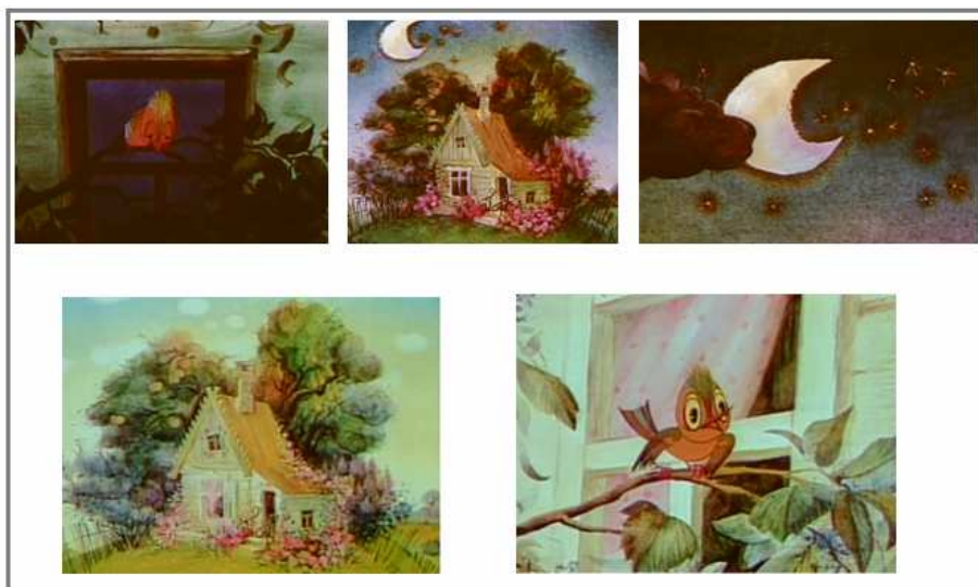
Рисунок 5. Сцени зміни сюжету протягом 0:38–1:12 хв

Проаналізуємо можливості сприйняття незрячими мультфільму без тифлокоментаря і з ним (взята частина м/ф з 0:38 по 1:12 хв) на прикладі фрагмента (рис.5).