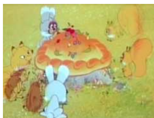
«Пахощі короваю принаджують лісових звірят, вони прибігли подивитися на диво-коровай» (4:21 хв).

Тифлокоментар надає можливість незрячим людям уявити собі весь спектр візуальних прийомів, які використовував автор Тифлокоментар ми розглядаємо як