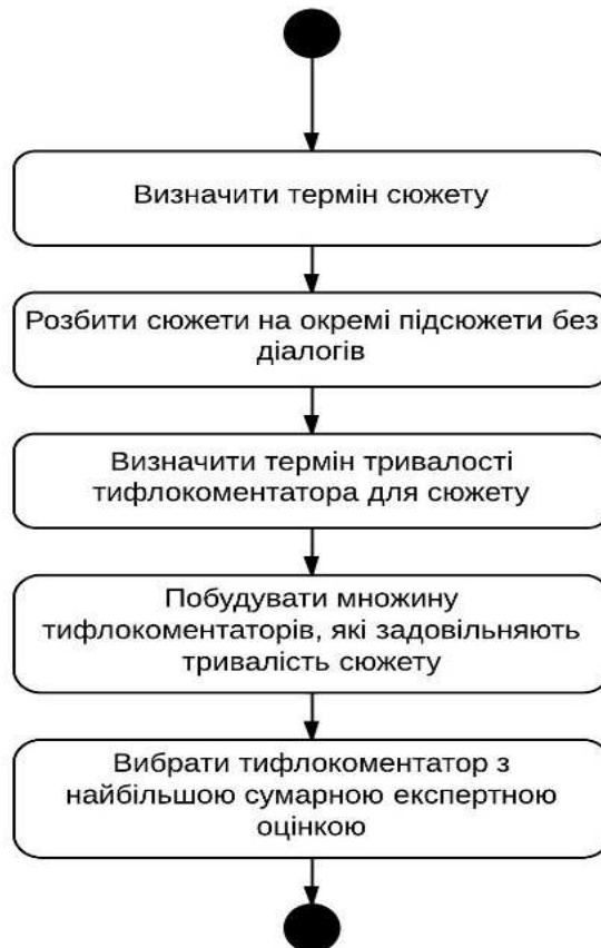
Figure 3. Activity diagram of typhlocomment choice to describe the plot