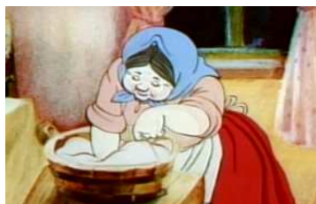
«У затишній хатці бабуся старанно місить тісто» (0:10 хв).

При наданні доступу користувачам з вадами зору до відеоконтенту слід враховувати, що більшість інформації надається людині за допомогою зображення, проте цією категорією інформація сприймається лише через слуховий та тактильний канал. Одним із реальних кроків вирішення проблеми обмеженості доступу до відеоконтенту для незрячих людей можна вважати використання тифлокоментаря, який відкриває великий простір для адаптації до соціуму не лише дорослих незрячих людей, а й дітей, які мають проблеми із зором, і які б могли переглядати мультфільми, вчитися рахувати, вивчати абетку за допомогою відеоконтенту з тифлокоментарем. Тифлокоментар – це закадровий опис відеоряду, складений сценаристом і начитаний тифлокоментатором. Розглянемо особливості функціонування розробленого нами комп'ютерного комплекс й створення відеоконтенту для незрячих на прикладі мультиплікаційного фільму «Сонячний коровай», який став першим відеоконтентом в Україні, доступним особам з повною або частковою втратою зору. Проаналізуємо кадри з мультфільму і тифлокоментар до цих епізодів: