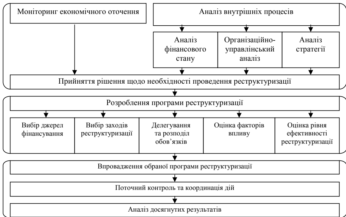
Рис. 3. Модель реалізації реструктуризації

Роль аналітичного етапу полягає у збиранні, аналізуванні та систематизації інформації для прийняття рішення щодо необхідності реструктуризації. На ньому виявляються негативні тенденції у господарській діяльності підприємства шляхом аналізу фінансового стану підприємства, організаційно-управлінського аналізу й аналізу стратегії підприємства.