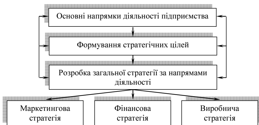
Рисунок 1. Фінансова стратегія у загальній стратегії розвитку підприємства

Фінансова стратегія виступає складовою загальної стратегії підприємства (рис.1), основна мета якої полягає у забезпеченні стабільно високих темпів прибутковості, а також фінансово-економічного й виробничо-господарського розвитку та зміцнення конкурентної позиції підприємства.