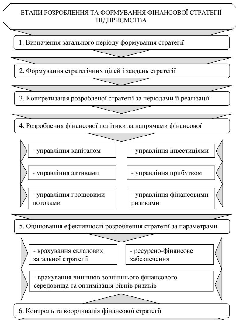
Рисунок 3. Процес розроблення та формування фінансової стратегії підприємства

Figure 3. The process of developing and shaping the financial strategy of the enterprise