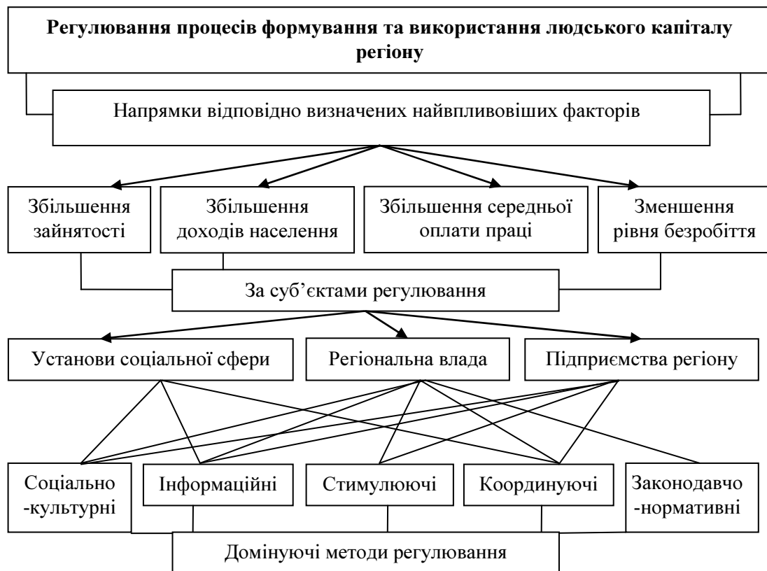
Рисунок 1. Основні напрямки та методи регулювання людського капіталу регіону* Figure 1. The main directions and methods of regulation of human capital in the region

Розглянемо основні методи регулювання процесів формування та використання людського капіталу регіону (рис.1). Серед домінуючих методів регулювання ми пропонуємо виокремлювати певні групи, а саме: соціально-культурні, інформаційні, стимулюючі, координуючі та законодавчо-нормативні.