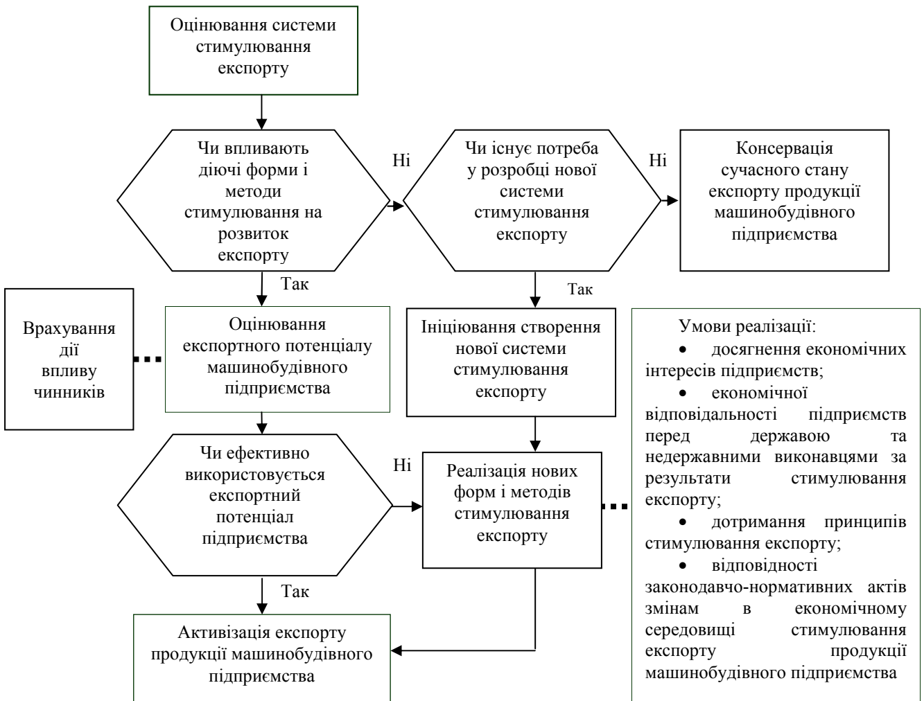
Рис. 2. Структурно-логічна схема процесу стимулювання експорту продукції машинобудівного підприємства

З метою визначення взаємозв'язку між системою стимулювання експорту продукції машинобудівних підприємств, що застосовується державою і недержавними виконавцями та результатами її впливу на розвиток такого експорту, побудовано логічно-структурну схему (рис. 2).