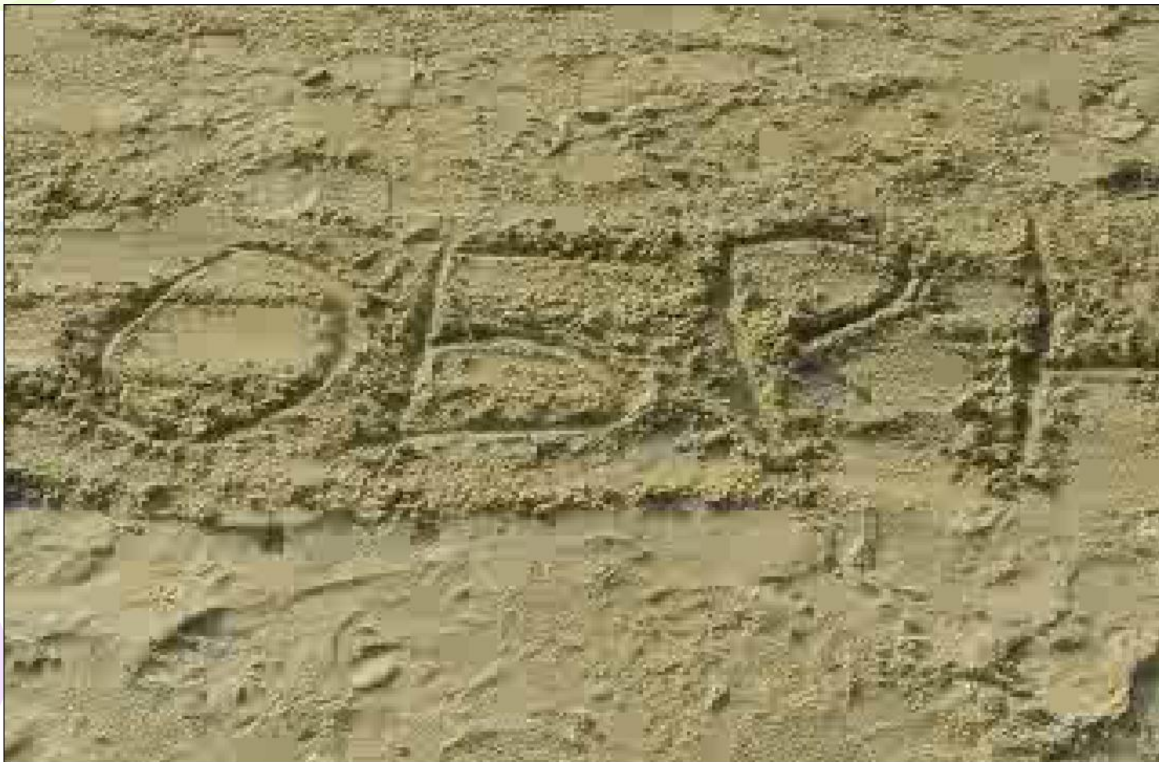
Образование 2.0 в песочнице.avi

http://www.youtube.com/watch?v=snw_HVhBp8c “Образование 2.0 в песочнице”)