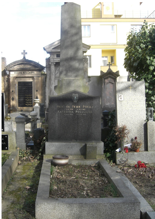
Могила Пулюя у Празі