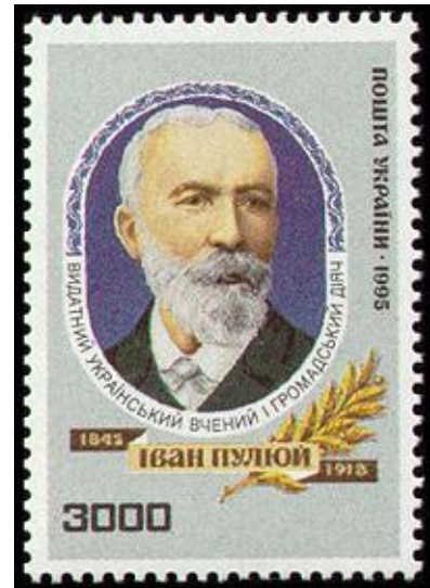
Поштова марка України, присвячена 150-річчю з дня народження Івана Пулюя