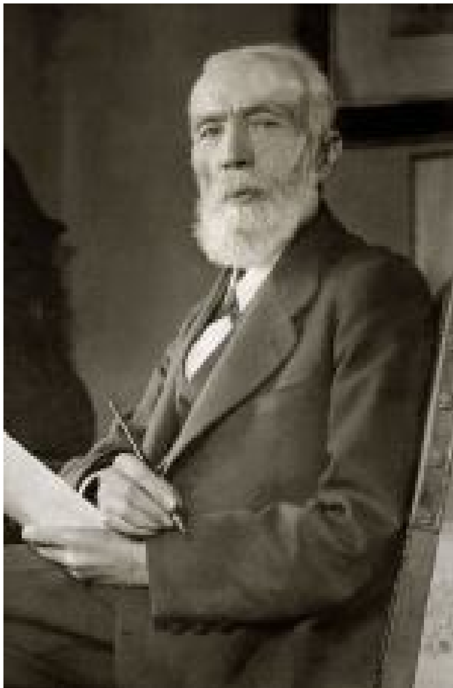
Пулюй Іван Павлович