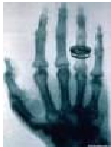
Знімок руки дружини, виконаний Іваном Пулюєм