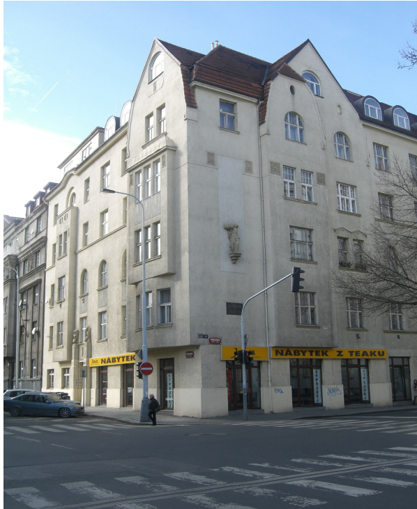
Будинок, де жив Пулюй в Празі