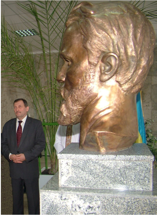
Відкриття пам'ятника І.Пулюя у ТНТУ імені Івана Пулюя