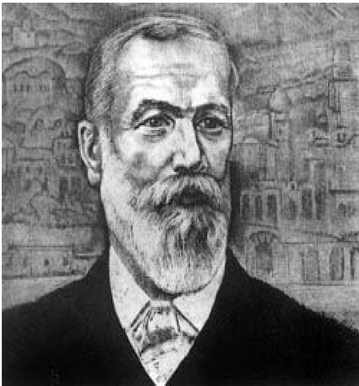
Пулюй Иван Павлович (1845—1918)