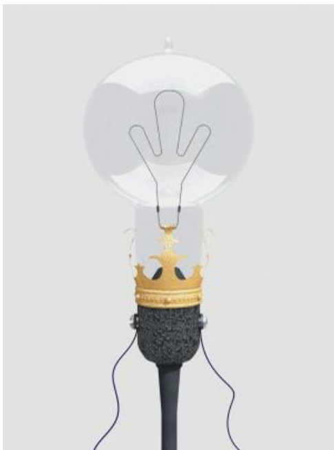
Електролампа конструкції Івана Пулюя