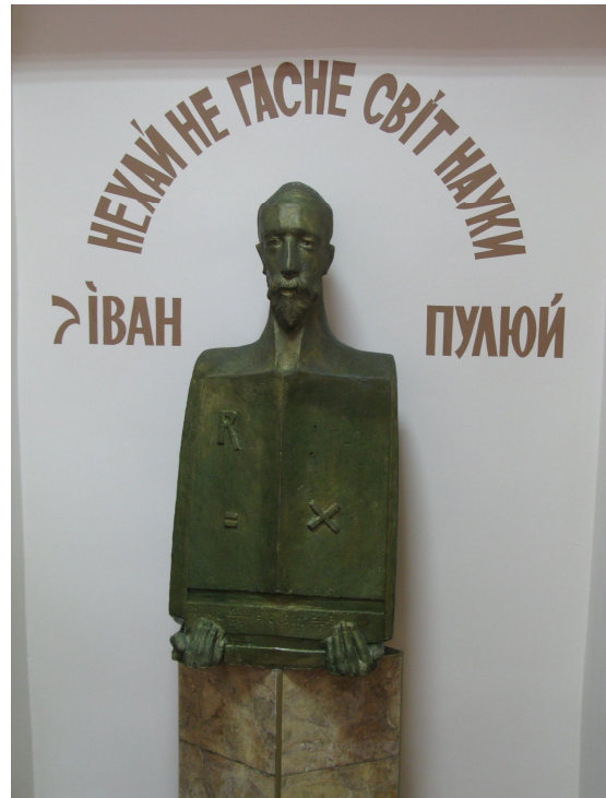
Погруддя Івана Пулюя, встановлене в читальному залі науково- технічної бібліотеки ТНТУ імені Івана Пулюя