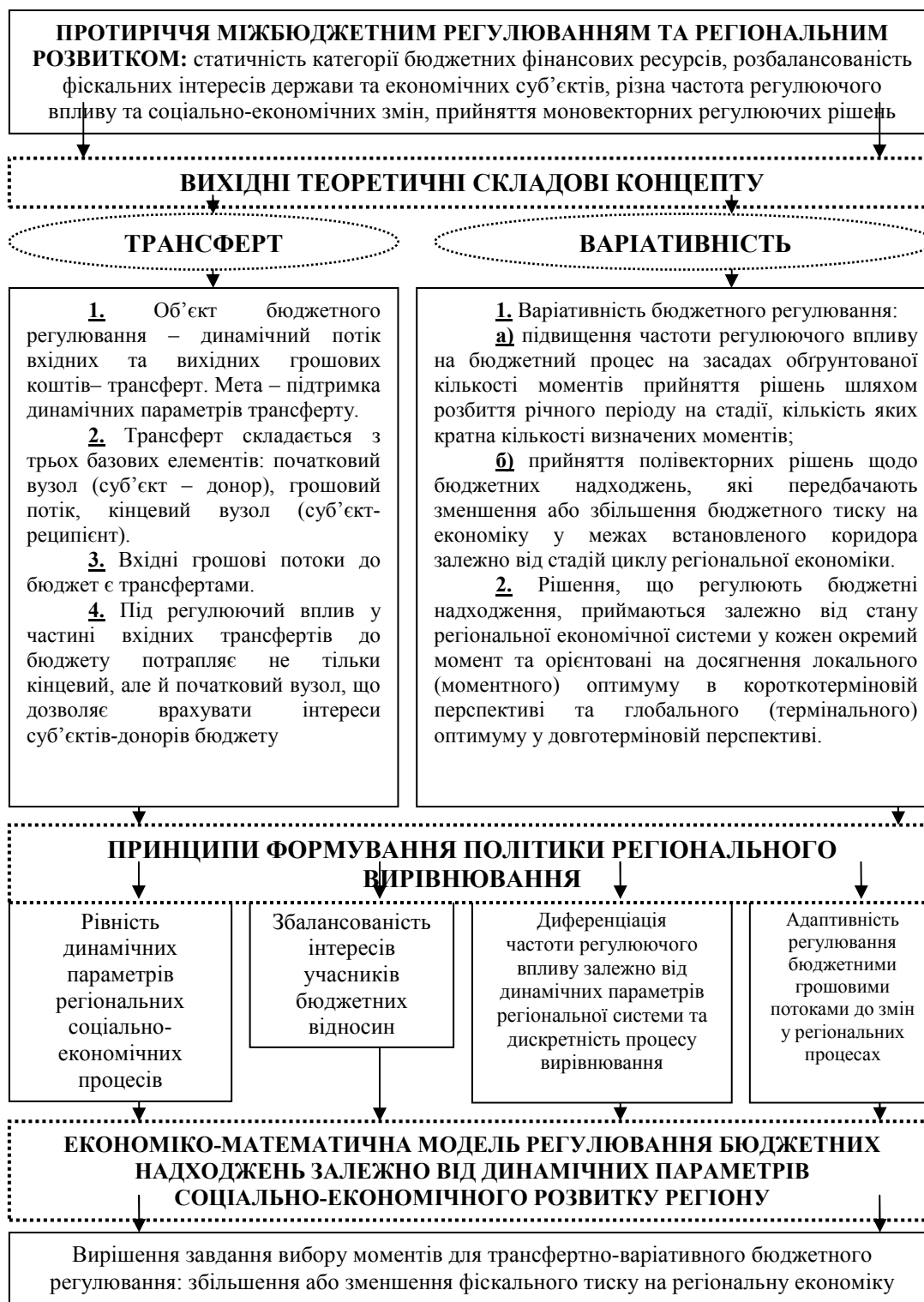
Рисунок 2. Концепція трансфертно-варіативного підходу до регулювання бюджетного процесу з метою забезпечення регіонального розвитку та вирівнювання Джерело: розроблено автором.