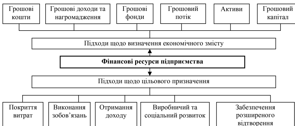
Рисунок 1. Класифікація підходів щодо форми вираження та цільового призначення фінансових ресурсів підприємства (власні дослідження автора)

Згідно з одними із найпоширеніших підходів фінансові ресурси визначаються як грошові кошти, які перебувають у розпорядженні суб'єктів господарювання. Такого підходу дотримуються, зокрема, І.Т. Балабанов, С.В. Мочерний, В.І. Осипов, О.Р. Романенко, А.М. Поддєрьогін, Є.Г. Рясних та ін. [1, 7, 8, 9, 10].