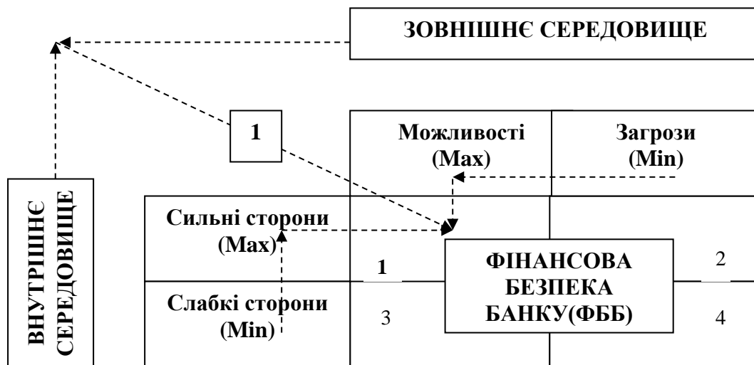
Рисунок 1. Матриця SWOT-аналізу стану фінансової безпеки банку

У дослідженні ми пропонуємо розглянути три матриці SWOT-аналізу для створення детальнішої картини вивчення ефективності управління банківською безпекою на основі розгляду її трьох станів, а саме: фінансової безпеки банку, фінансових загроз та фінансової небезпеки банку. SWOT- матриця фінансової безпеки банку зображена на рисунку 1.