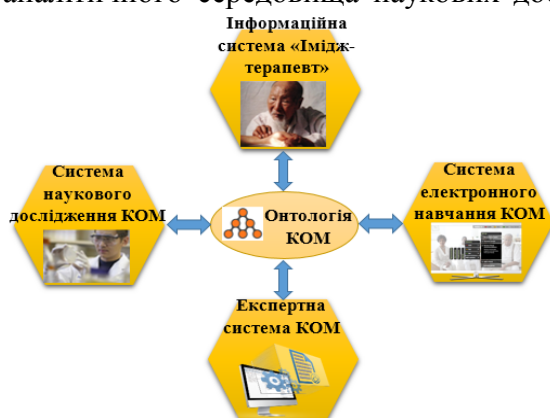
Рис.1. Структура ІС КОМ

Згідно зі стратегією Всесвітньої організації охорони здоров'я в сфері народної медицини [1], нормативними документами Міністерства охорони здоров'я України [2], Програмою наукових досліджень китайської образної медицини на 2017-2023 роки [3] та зважаючи на необхідність входження КОМ в область інтегральної медицини як науково обґрунтованої медичної галузі, актуальним науковим та прикладним завданням є створення онтології КОМ як основи інтегрованого онтоорієнтованого інформаційно-аналітичного середовища наукових досліджень, професійної цілительської діяльності та електронного навчання КОМ (далі ІОІАС). Метою розробки ІОІАС є забезпечення ефективної організації та координації діяльності діючих КОМ-терапевтів, наукових дослідників КОМ, осіб, що вивчають КОМ, а також формування сучасних інтелектуалізованих інформаційних засобів та ресурсів в сфері народної, комплементарної та інтегральної медицини як на національному, так і на міжнародному рівнях.