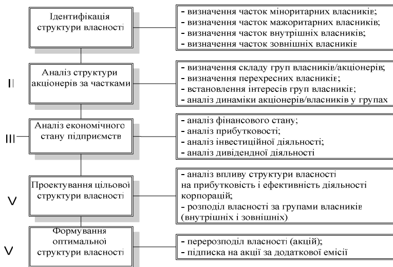
Рис. 3. Схема процесу формування оптимальної структури власності підприємства.

Важливо адекватно відобразити взаємозв'язок між структурою корпоративної власності та економічним станом підприємства. При цьому насамперед потрібно провести структурно-динамічний аналіз корпоративної власності (акціонерного капіталу). Проектування цільової структури корпоративної власності треба розпочинати лише після опрацювання результатів аналізу, отриманих попередньо на основі сформованого дерева цілей підприємства на перспективу. Оптимальна структура корпоративної власності має сприяти, з одного боку, концентрації капіталу в руках ефективного власника, а з іншого – стратегічній меті корпорації. Запропонований підхід до оптимізації структури корпоративної власності у виконанні завдань ефективного управління підприємством власники промислових підприємств можуть використати задля формування принципів ефективного функціонування підприємств; згаданий підхід також допоможе їм розв'язати проблему формування ефективного власника. Використання такого підходу на підприємствах із розпорошеною структурою власності дасть змогу ідентифікувати і структурувати проблему необхідності формування ефективного власника.