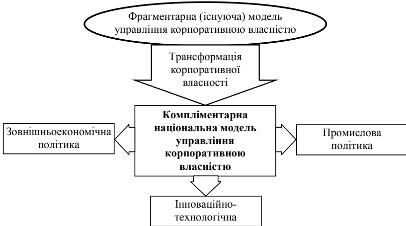
Рис. 2. Узагальнена схема процесу формування унікальної національної моделі управління корпоративною власністю.

Перманентні процеси перерозподілу власності між інсайдерами й аутсайдерами відвернули увагу всіх учасників корпоративних взаємин від безпосереднього процесу управління такими підприємствами. Це стало гальмом у розвитку великих промислових підприємств і дало змогу інсайдерам за рахунок внутрішніх управлінських технологій маніпулювати прибутковістю діяльності корпорацій та, відповідно, доходами власників корпоративних прав.