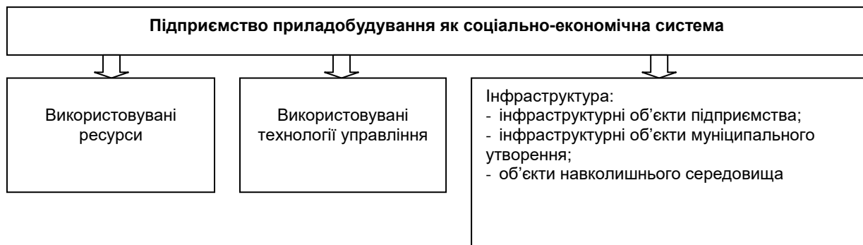
Рис. 1. Структурні та функціональні складові ситуаційного управління приладобудівним підприємством у муніципальній економічній системі

Здійснення ситуаційного управління приладобудівним підприємством у муніципальній економічній системі вимагає виокремлення його структурних і функціональних складових (рис. 1).