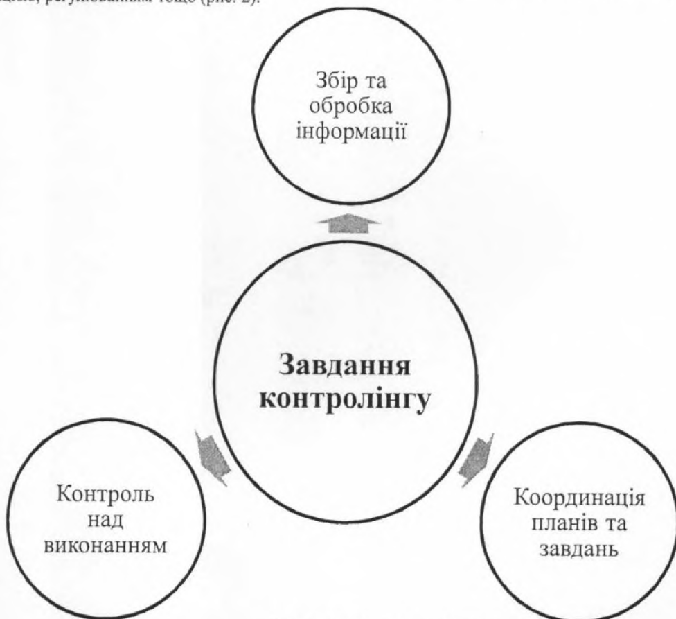
Рис. 2. Завдання контролінгу

Тоді як завданнями контролінгу спрямовані на управління інформацією, її збором, аналіз координацією, регулюванням тощо (рис. 2).