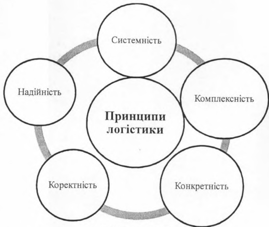
Рис. 1. Принципи логістики