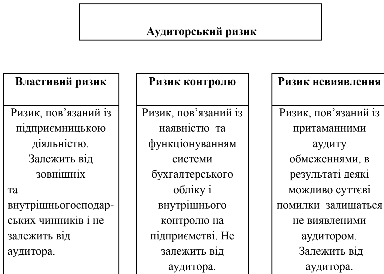
Рис.1. Аудиторський ризик

перекручення. Інакше кажучи, за неправильно підготовленою звітністю буде представлено аудиторський висновок без зауважень і навпаки.