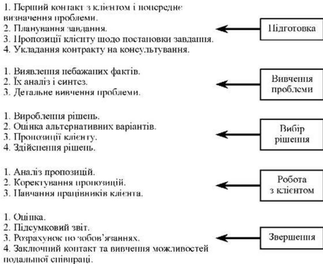
Рис. 5.1. Схема процесу консультивання

Процес консультивання охоплює два однаково важливі аспекти консультаційного процесу: роботу, для якої був запрошений консультант, і взаємовідносини між консультантом і клієнтом.