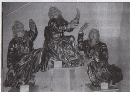
Апостоли Петро, Яків, Іван Богослов

З парафіяльної іконографічної збірки виділимо, зокрема, анонімні живописні зображення на полотні, які узагальнено можна датувати в хронологічних межах др. пол. XIX – поч. XX ст. Це: «Діва Марія з Ісусом», «Каїн вбиває Авеля», «Апостол Павло», «Євангеліст Матфій».